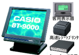
15インチ液晶一体型PC-POS (BT-9000)