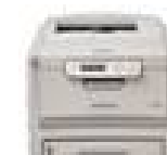
カラーページプリンタ

「Check-fit」は、カシオ計算機(株)の登録商標です。「Edy(エディ)」は、ビットワレット株式会社が管理するプリペイド型電子マネーサービスのブランドです。