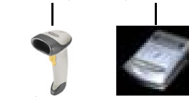
バーコード レーザースキャナ