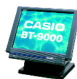
タッチスクリーンターミナル