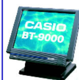
タッチスクリーンターミナル