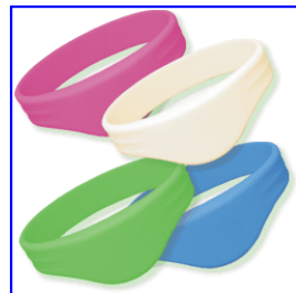
【低価格!ICリストバンド対応】